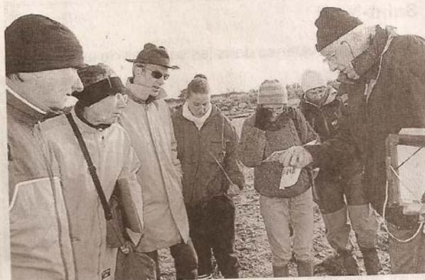
Ces stagiaires d'un jour ne verront plus l'estran de la même façon !

Concilier pratique du kayak et protection de l'environnement, c'est possible ! Encore faut-il que chacun connaisse bien la flore et la faune, les écosystèmes côtiers et sache que tout ce milieu naturel est fragile. C'est dans cet esprit que l'association costarmoricaine Interactions a organisé, ce week-end à Séné, une session de formation à l'environnement, en partenariat avec Bretagne vivante et le club de kayak de Vannes.